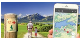
Simuliertes Sehen mit Trifokallinsen (Multifokallinsen)